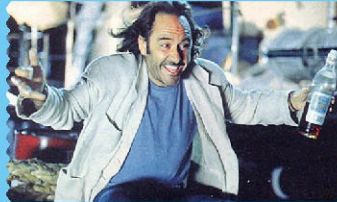
COMO UN RELÁMPAGO | MIGUEL HERMOSO, 1996

Película sobre un abogado madrileño que viaja a Las Palmas para reencontrarse con la mujer de la que está enamorado. una cubana ex drogadicta y ex delincuente a la que defendió. Seleccionado en la Semana Internacional de la Crítica del Festival de Cannes.