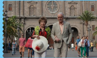
COMO REINAS | ANDY TENNANT, 2016