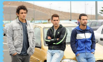
EL NIÑO | DANIEL MONZÓN, 2014

Retrato ácido de una familia de barrio de Las Palmas con Eduardo Casanova, Macarena Gómez y Antonia San Juan en sus papeles protagonistas.