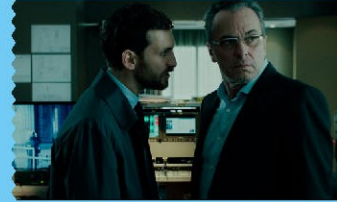
CIEN AÑOS DE PERDÓN | DANIEL CALPARSORO, 2016

Alocada comedia protagonizada por Shirley MacLaine, Jessica Lange y Demi Moore sobre una septuagenaria que recibe por error un cheque millonario y emplea el dinero en un viaje a Gran Canaria.