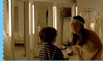
LAS OVEJAS NO PIERDEN EL TREN | ÁLVARO FERNÁNDEZ ARMERO, 2015

Última película de la saga de terror REC, de Jaume Balagueró y Paco Plaza. Para su protagonista, Manuela Velasco, el pesquero ruso del puerto de La Luz donde se filmó es uno de los personajes más siniestros de las cuatro entregas.