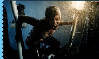
REC 4: APOCALIPSIS | JAUME BALAGUERÓ, 2014

Éxito de taquilla nominado a 16 Premios Goya. Un thriller sobre el narcotráfico en el Estrecho de Gibraltar. Protagonizado por Luis Tosar, Eduard Fernández y Bárbara Lennie, dio a conocer al actor Jesús Castro.