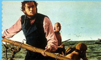
MOBY DICK | JOHN HUSTON, 1956

Hollywood adaptó el clásico de la literatura de Hermann Melville, con guión de Ray Bradbury y John Huston y protagonizada por Gregory Peck como el Capitán Ahab. Fue la película más taquillera en EEUU. Considerada de las mejores cine películas de la historia del cine.