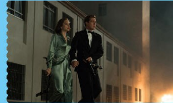
ALIADOS | ROBERT ZEMECKIS, 2016

Thriller sobre un atraco a un banco protagonizado por Raúl Arévalo, José Coronado y Raúl de la Serna. De las películas más taquilleras de 2016. Las Palmas se convirtió en la ciudad española de Valencia.